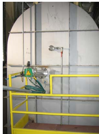
KNAUF INSULATION (TERMO) Škofja Loka, Slovenia Proizvodnja kamene volne, AMS: CO, CO 2 , O 2 , prah, O 2 (In-situ) ČISTILNA NAPRAVA ODPADNIH PLINOV KUPOLNE PEČI