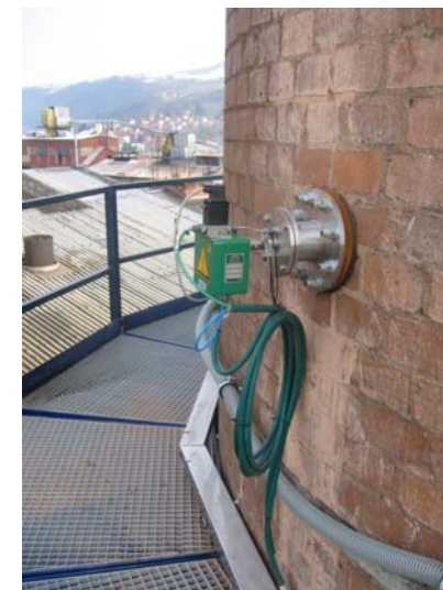
VIPAP VIDEM Krško velika kurilna naprava AMS: vlaga (H 2 O) - suho/vlažna metoda (vsebnost O 2 )