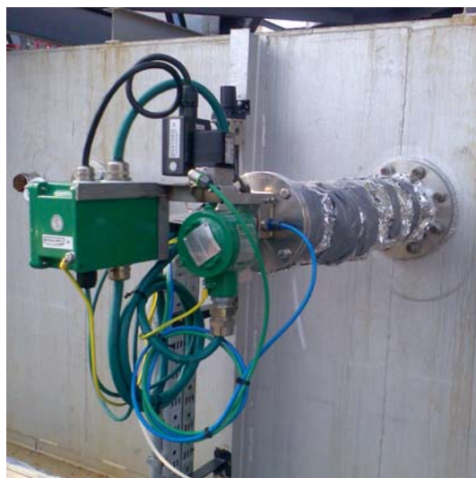
INA URINJ, Reka, Hrvaška rafinerija AMS: O 2 , sonda OXITEC: ATEX II 2G EEx d IIC T3